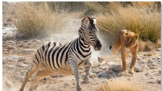
Dieses Zebra konnte knapp, aber erfolgreich flüchten