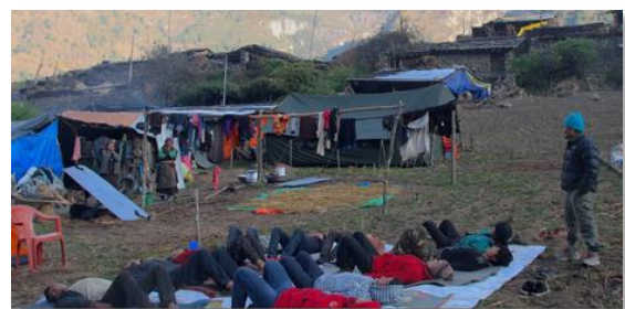
TRE® bei einer Gruppe in Nepal

Ursprünglich entstanden die TRE®-Übungen für eine praktische Arbeit mit vielen traumatisierten Menschen gleichzeitig, z.B. während einem Krieg oder nach einer Katastrophe. Auf diesem Weg waren bis zum Jahre 2010 nach eigenen Angaben von Dr. Berceli 40'000 Menschen in 17 Ländern in Berührung mit TRE®-Übungen gekommen. Die Übungen sind